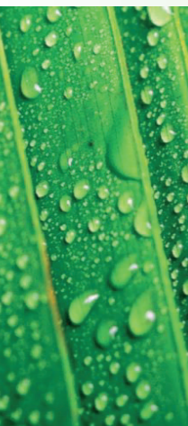
Močilo - adjuvant

UPORABA V KORUZI: 1-2 L/ha v fazi 4- 6 lista koruze (tudi kasneje če je potrebno).