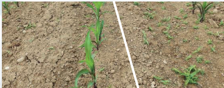
BOTIGA (0,5 L/ha) + zmanjšan odmerek tienkarbazon metil/izoksafutol

BOTIGA 0,5 L/ha + 22,5% izoksafutola in 9% tienkarbazon-metila 0,3-0,35 L/ha + HI-WETT 0,1 L/ha